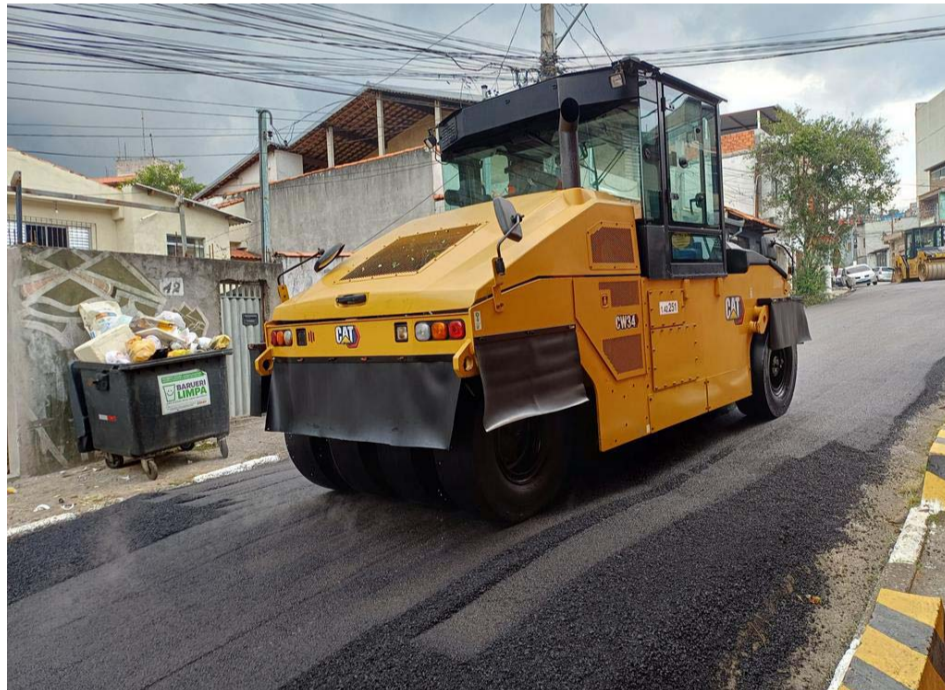
O serviço de pavimentação também é desenvolvido nos projetos viários previstos para entrega neste ano