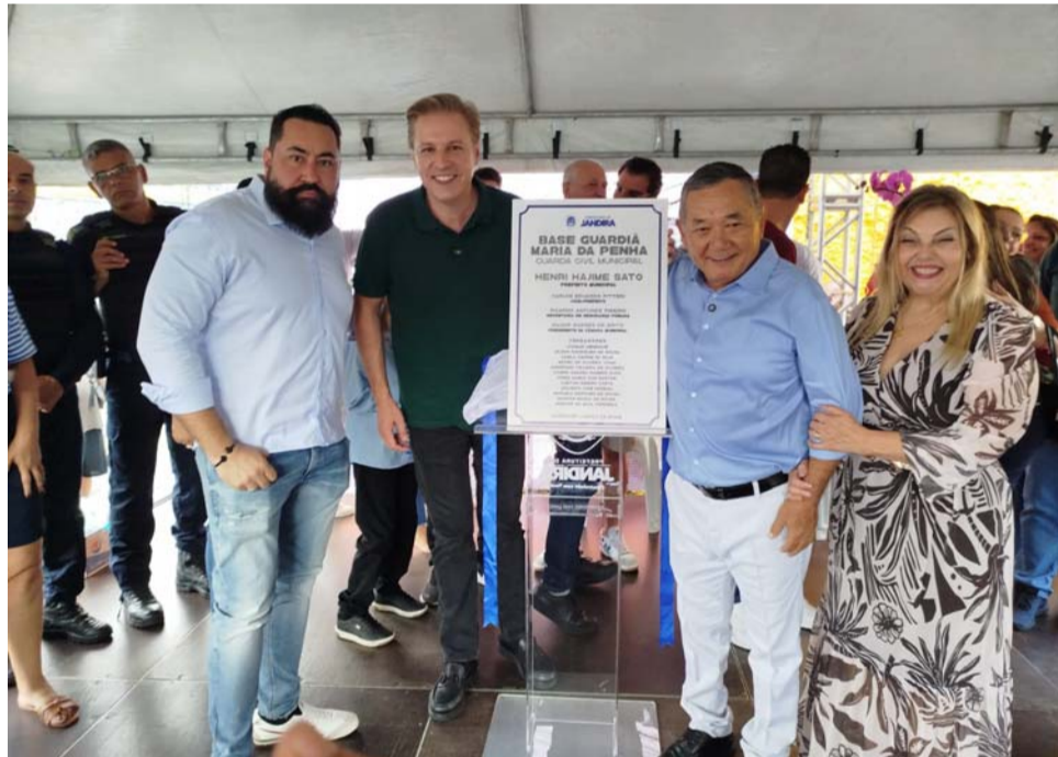
Foi inaugurada a Base da Guarda Maria da Penha da Guarda Civil Municipal no bairro Sagrado Coração